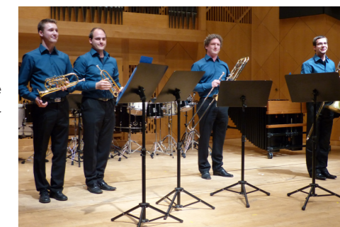
Bläserquartett, anlässlich eines anderen LMN-Konzertes