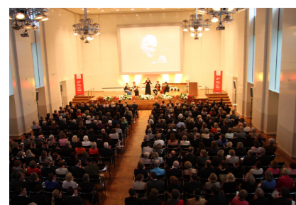
Blick in den Saal